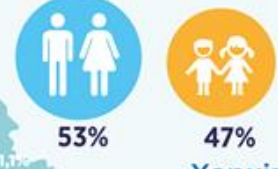
ВІКОВИЙ РОЗПОДІЛ ДЗВІНКІВ